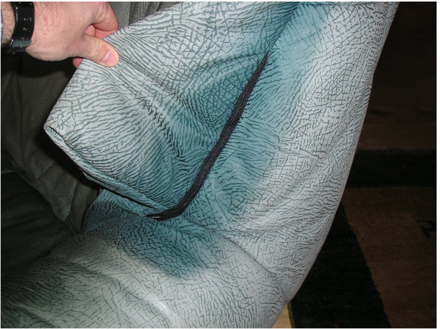
Stark ausgebleichenes geprägtes Nubukleder: Fachbetrieb fragen