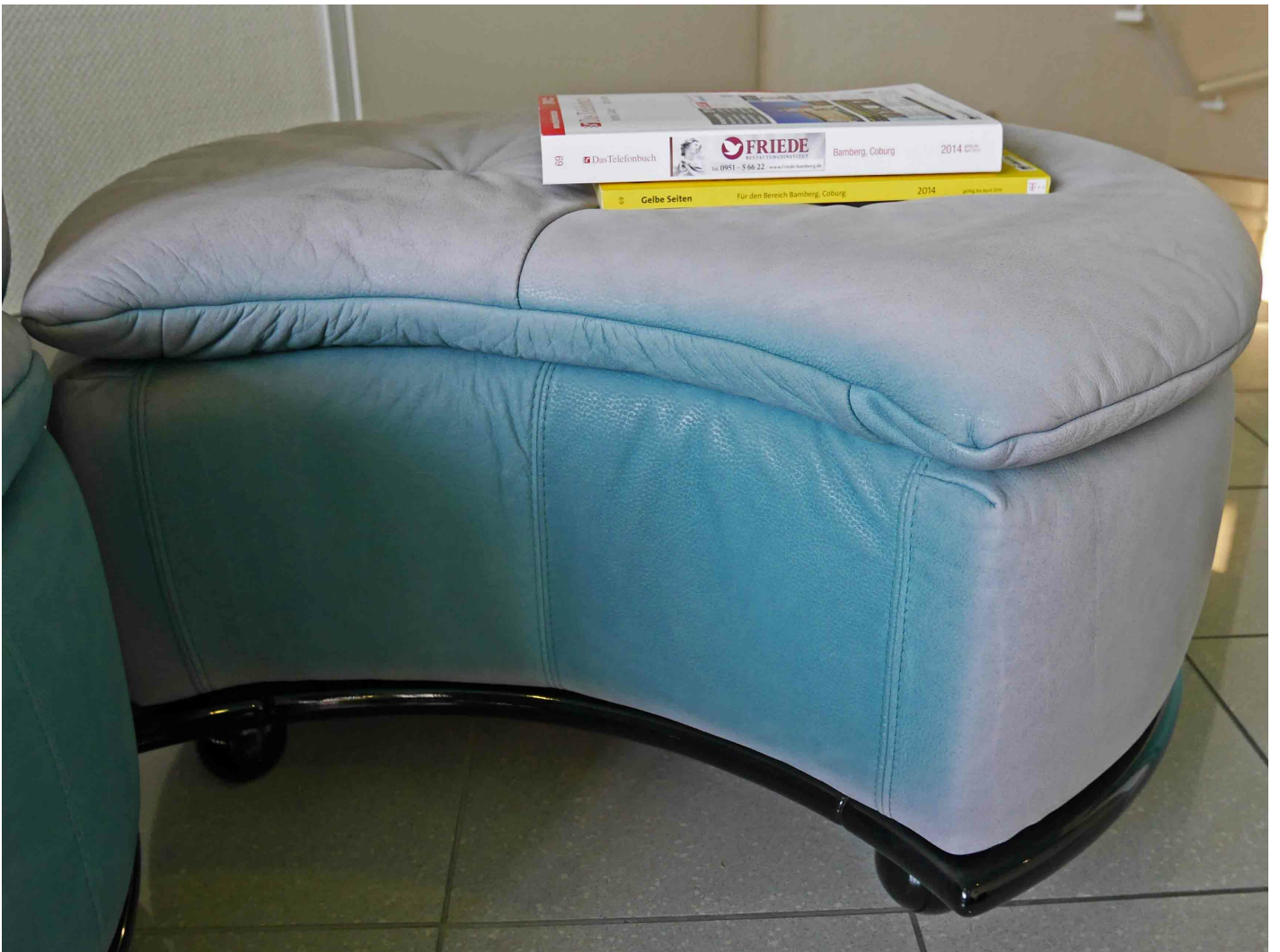
stark verblichen, Rettung evtl. durch Fachbetrieb