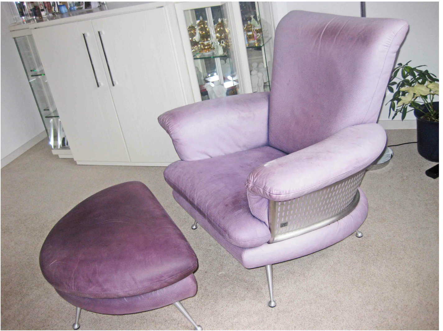
leicht verspeckt, mit Nubuk Set und Reinigungsbenzin zu bearbeiten