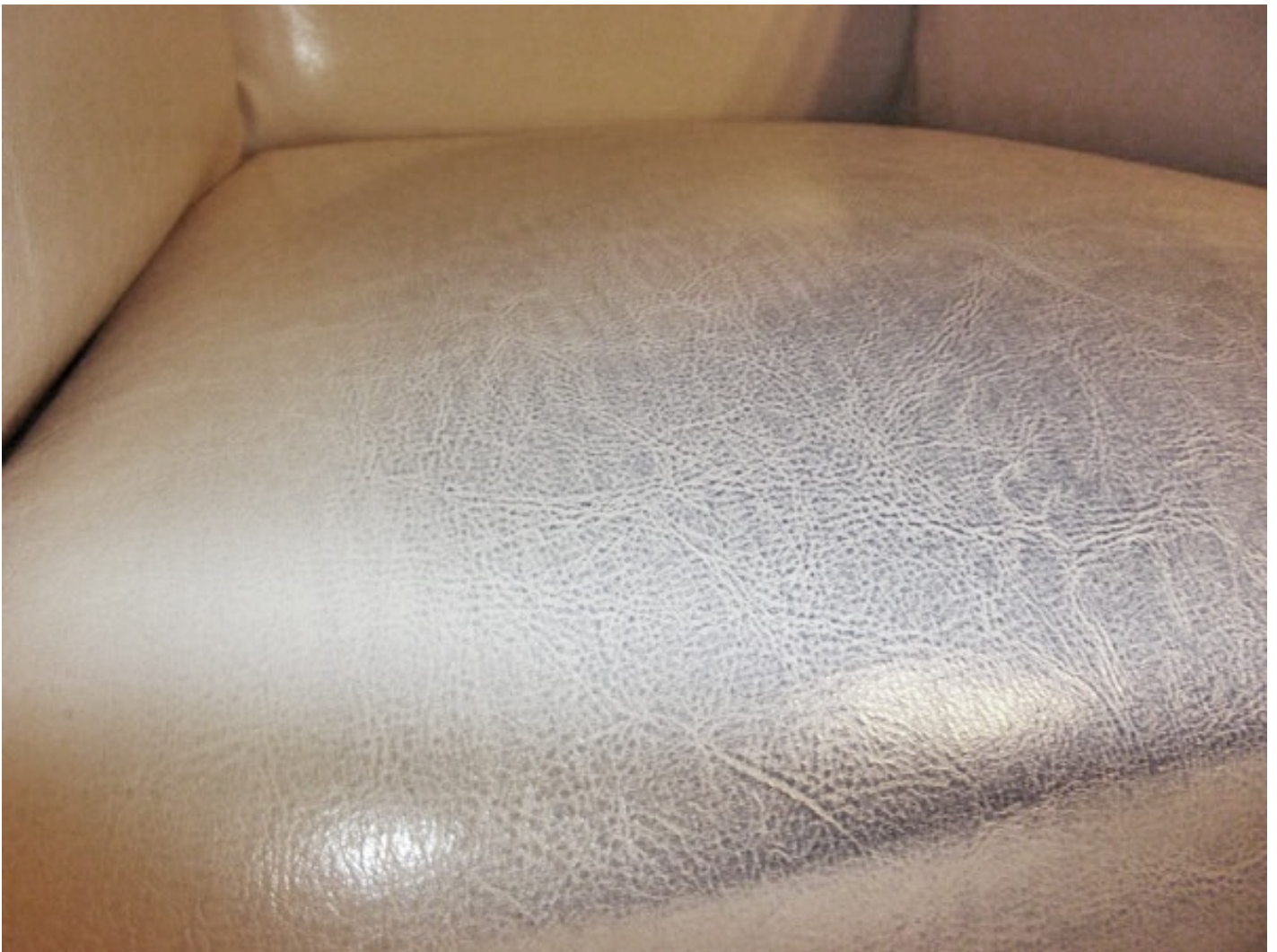
Starke Abfärbungen auf Möbelleder