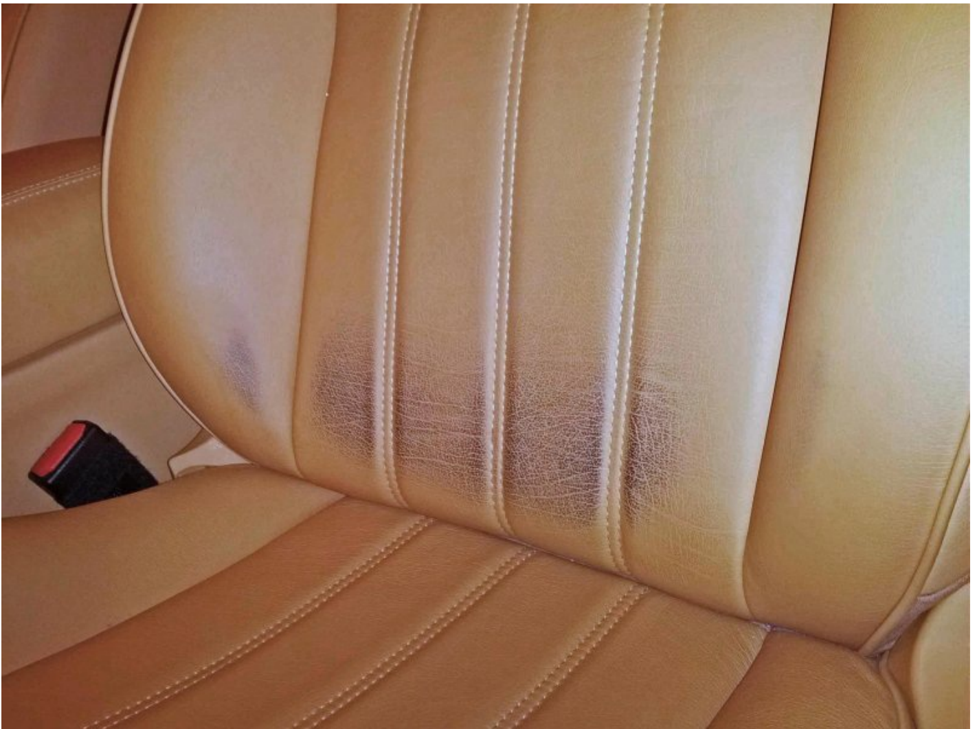
Jeansabfärbung auf Autoleder im Einstiegsbereich und Gürtelabfärbung auf das Leder vom Rückenpolster