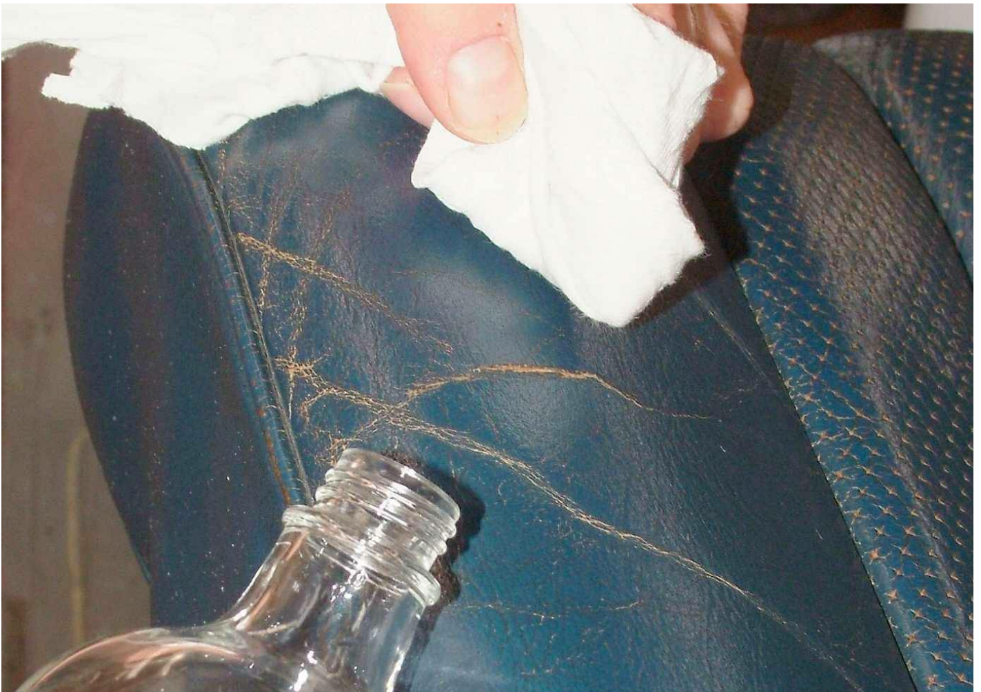
Mit Reinigungsbenzin entfetten