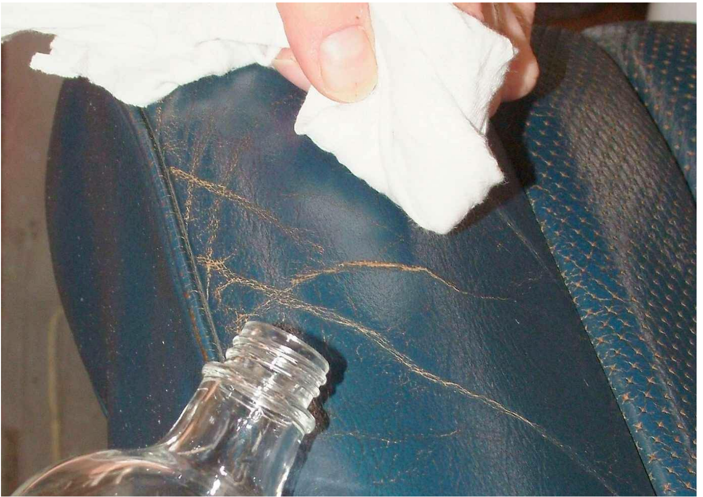
Mit Reinigungsbenzin entfetten