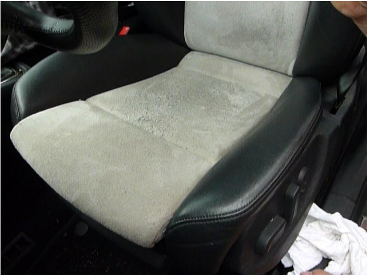
Alcantara hat gelegentlich das Problem der Verfilzung, auch "Pilling" genannt. Beachten Sie den Film dazu.