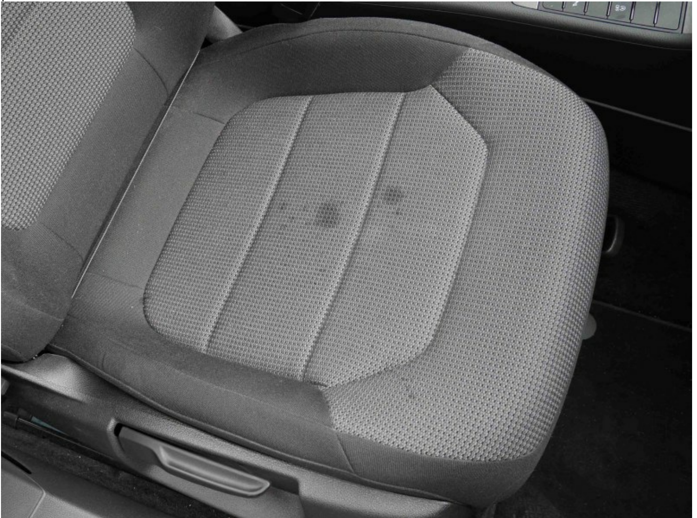
Flecken im Textilgewebe

Flasche vor der Anwendung schütteln. Den Reiniger immer zuerst an verdeckter Stelle auf Veränderungen prüfen!