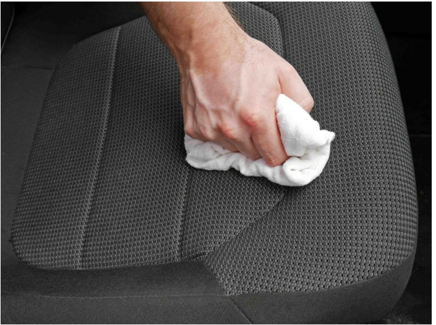
Mit Frottee abreiben