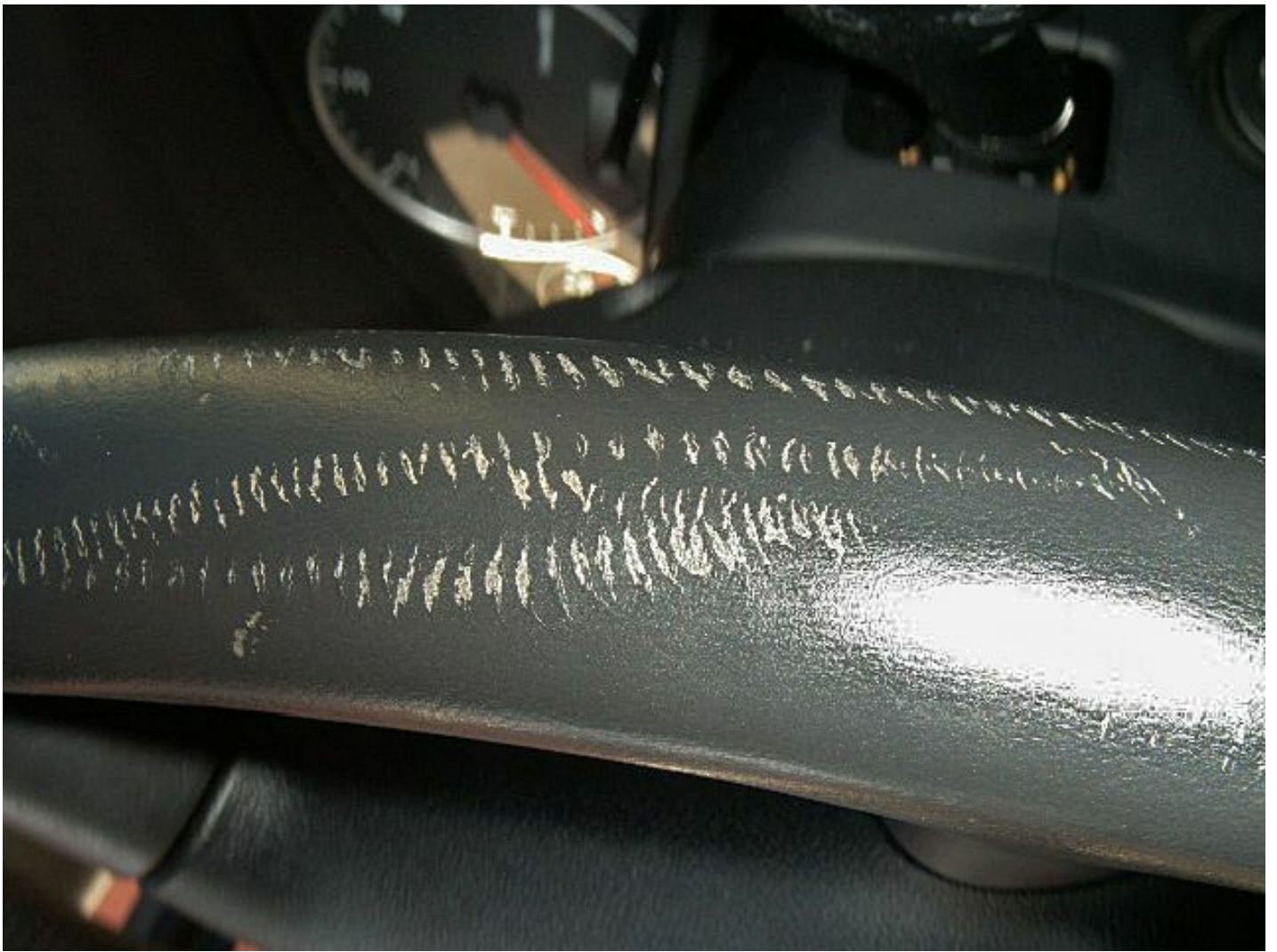
Der Farbunterschied lässt sich mit Leder Fresh ausgleichen. Narben werden sichtbar bleiben.