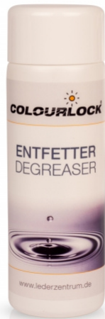
Entfetter 250 ml