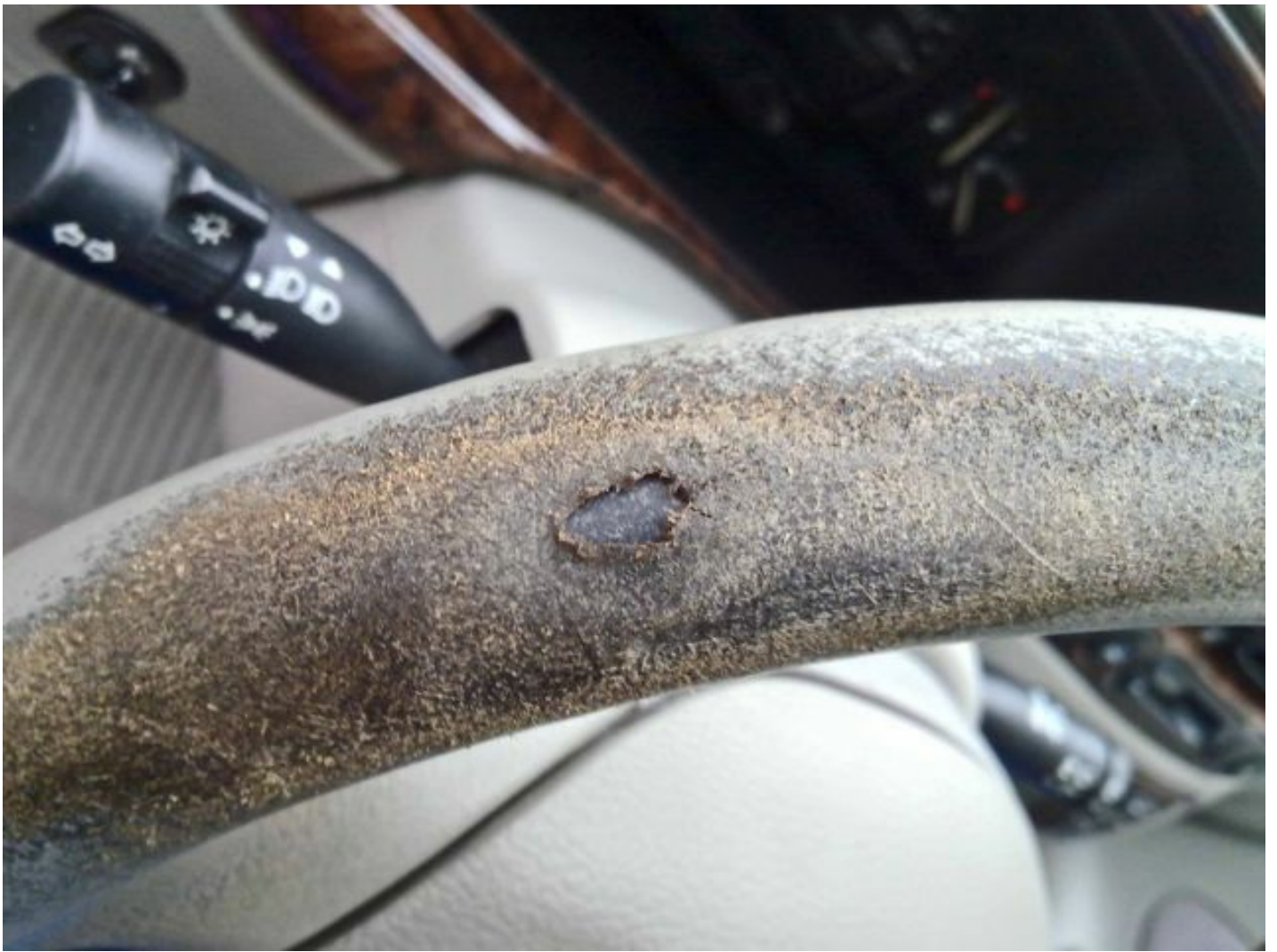
Das Lenkrad wird nicht wieder wie neu. Besser neu beziehen lassen.