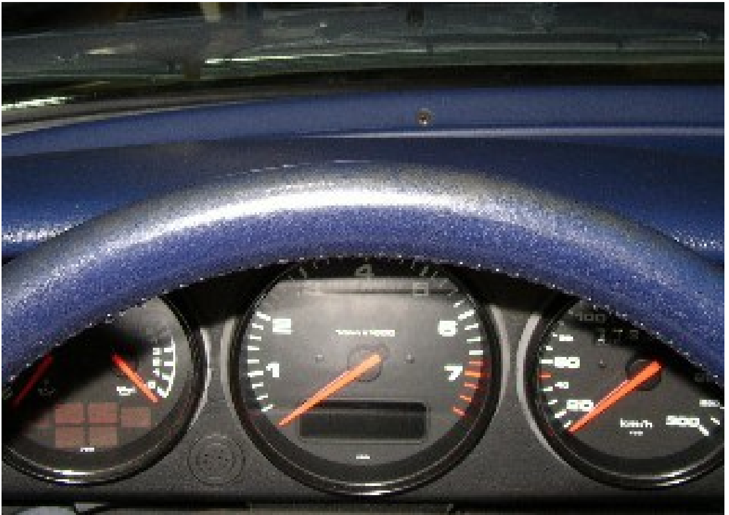
Abgegriffen: Kundenbild vor Behandlung mit Leder Fresh

Video über die Bearbeitung von Lenkrädern