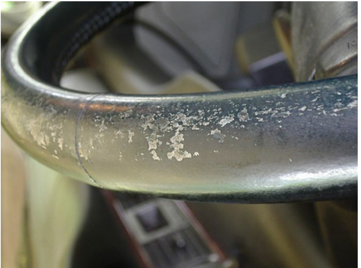
Aufgeraut: Schleifpad verwenden