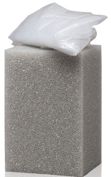
Leder Fresh 150 ml