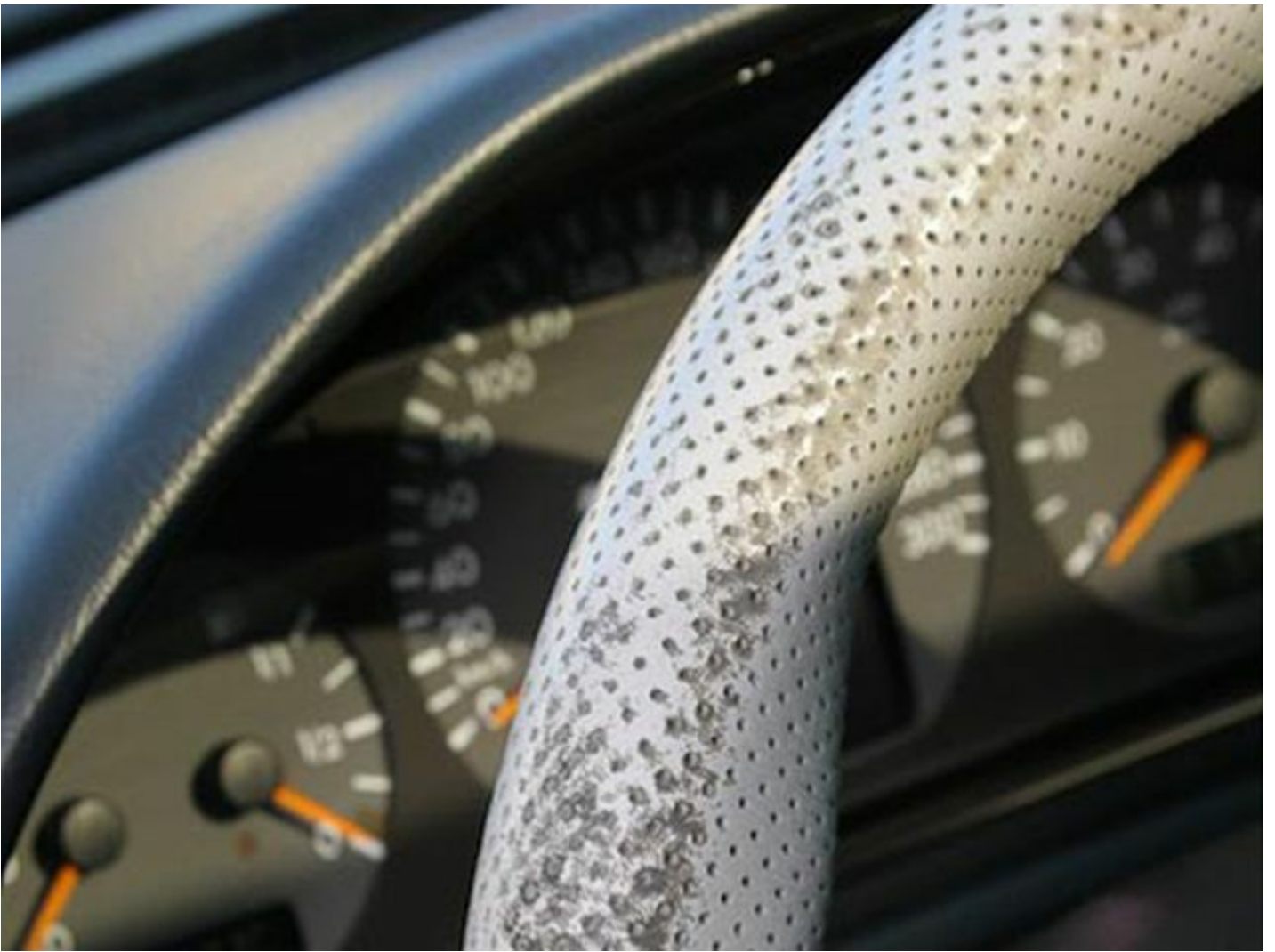
Perforiert: Gut entfetten