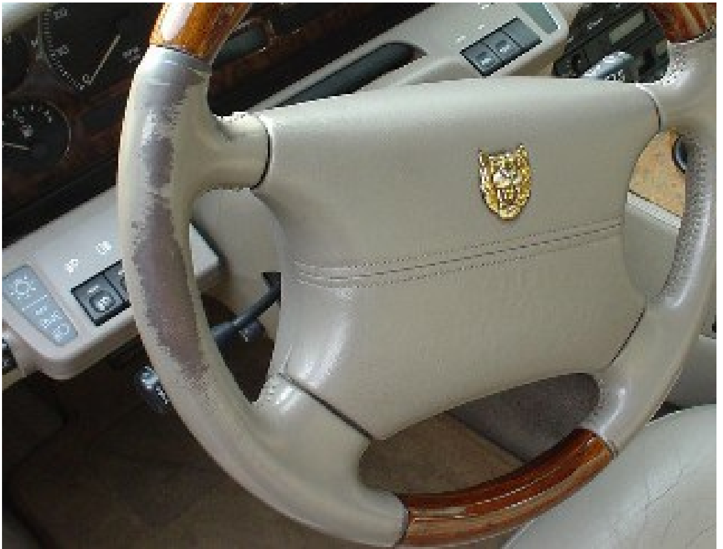
abgegriffen: Entfetten, dann Leder Fresh in richtiger Farbe auftragen