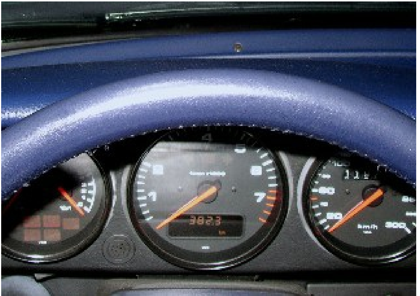
nach Entfettung, Schleifpad und Leder Fresh in passender Farbe