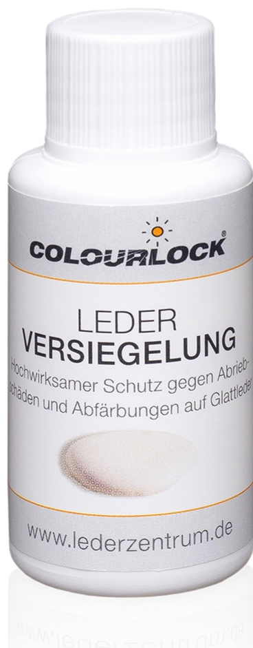
Leder Versiegelung 30 ml