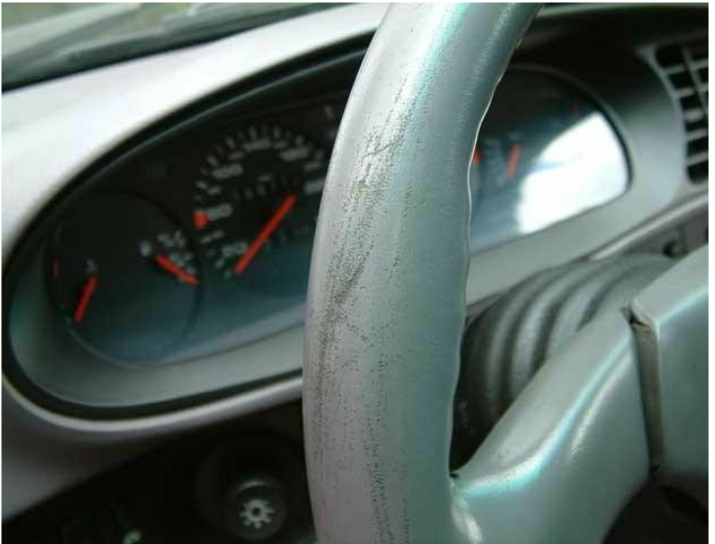
Kratzer durch Ring, auch mit Fresh lösbar