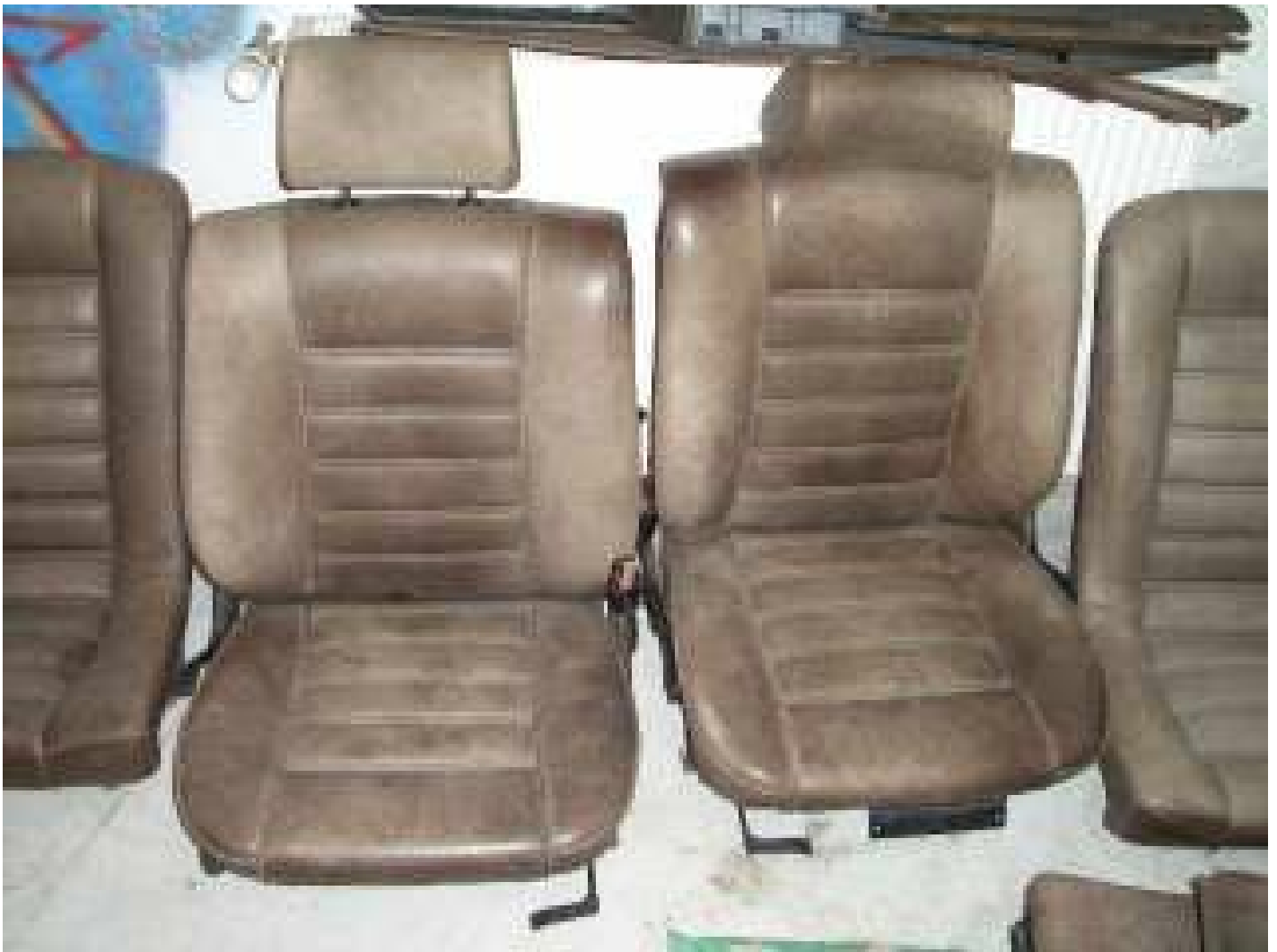
BMW-Büffelleder, dunkelbraun verblichen