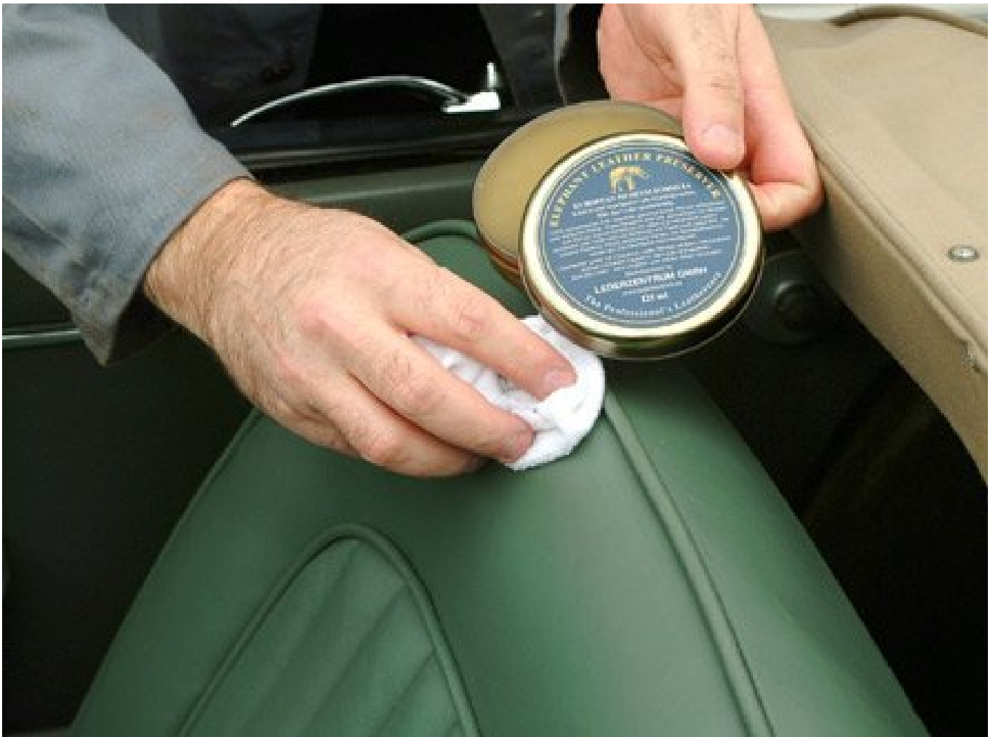
Das COLOURLOCK Elephant Lederfett schützt und imprägniert zusätzlich das Leder von Cabrios.