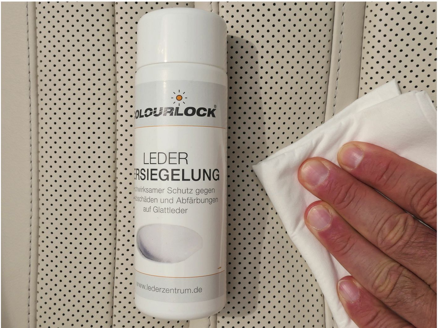
Die COLOURLOCK Leder Versiegelung schützt neue Leder vor Verschleiß und Gebrauchsspuren.