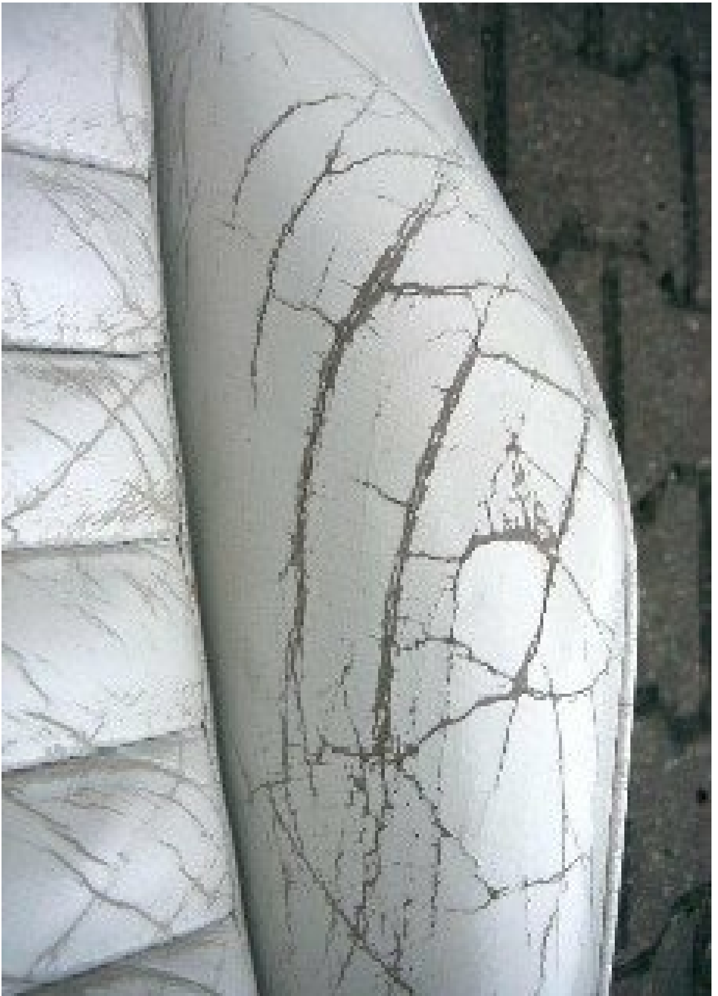
Ein Grenzfall bei weiterem Gebrauch, da das Leder durch Alterung schon stark geschwächt ist. Siehe Infotexte " Risse " und " Raue Flächen ".