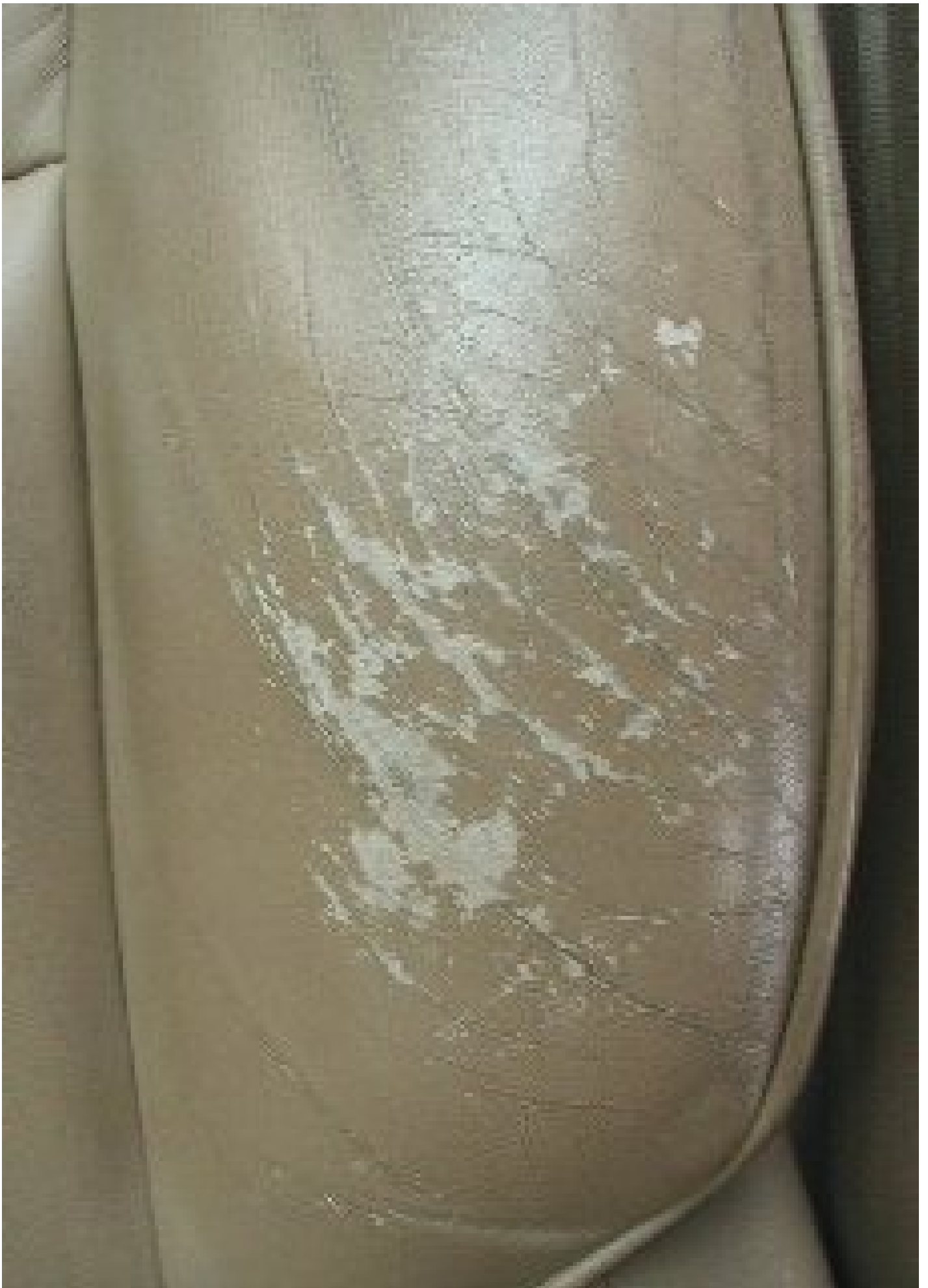
Typischer und leichter Fall für Leder Fresh.